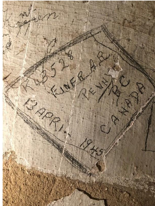
Nagelaten in een van de muren van de cel van de Dikke Hertog door de Canadese soldaat Archibald Finer

Er zijn nog andere verhalen over De Nijenbeek. Volgens sommige zou die geheime kamers en schatkisten bevatten. De precieze inhoud van deze schatten verschilt per verhaal, maar goud, juwelen en oude documenten komen vaak voor. Spookverhalen zijn er ook. Zo zou er een witte vrouw rondwalen, een jonkvrouw die op tragische wijze om het leven is gekomen. Ook zou het kasteel bewoond worden door de geesten van voormalige bewoners.