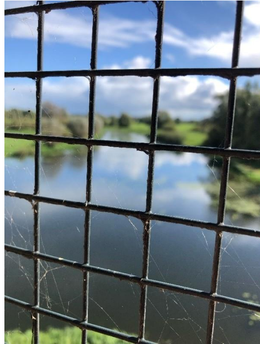
Uitzicht vanuit de donjon op de IJssel

De Ruïne De Nijenbeek is een indrukwekkend overblijfsel uit het verleden, gelegen aan de oever van de Voorsterbeek, een oude arm van de IJssel. Dit kasteel met voorburcht heeft een tumultueuze geschiedenis die teruggaat tot de 13e eeuw. Het kasteel heeft verschillende eigenaren gekend; van de 16e eeuw tot de 19e eeuw werd erin gewoond. De Nijenbeek heeft door de eeuwen heen te maken gehad met oorlogen en verwoestingen.