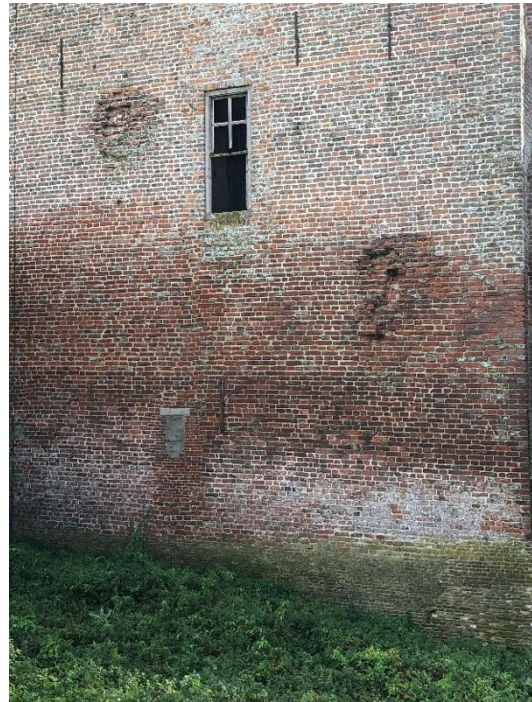
Granaatinslagen uit WO2

In 1523 werd het kasteel gedeeltelijk afgebroken door hertog Karel van Gelre. Tijdens de Tweede Wereldoorlog, in 1945, werd de Nijenbeek zwaar beschadigd door geallieerde beschietingen; de granaatinslagen zijn nog steeds zichtbaar.