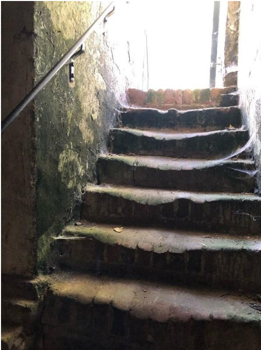
Toegang tot de cel van de Dikke Hertog

Ondanks de historische feiten, is de legende van de Dikke Hertog een stuk aantrekkelijker. Het beeld van een hertog die zo uit de hand loopt dat hij zelfs zijn eigen gevangenis ontgroeit, spreekt tot de verbeelding. De legende is een mix van historische feiten, folklore en een vleugje humor.